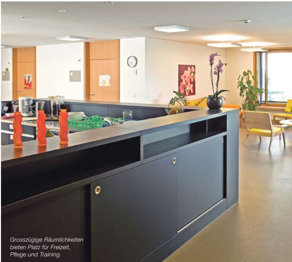
Grosszügige Räumlichkeiten bieten Platz für Freizeit, Pflege und Training.