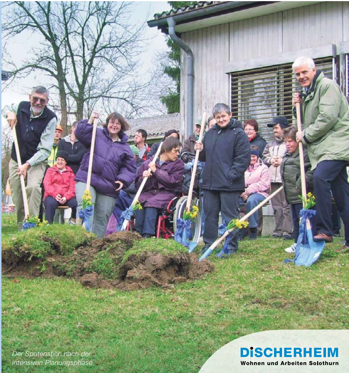
Der Spatenstich nach der intensiven Planungsphase.

Nach einer intensiven Planungsphase erfolgte im März 2008 der erste Spatenstich. Zwei Monate später konnte im Beisein von Regierungsrat Peter Gomm der Grundstein gelegt werden. In einer Schatulle wurden gemäss altem Brauch neben den Plänen des Baus auch persönliche Gegenstände der Betreuten und Betreuenden in die Bodenplatte des Neubaus zementiert. Bereits 13 Monate später konnten alle Bewohner in den Neubau umziehen – und die Nacht auf den 1. August 2009 erstmals in ihrem neuen Heim und Zuhause verbringen.